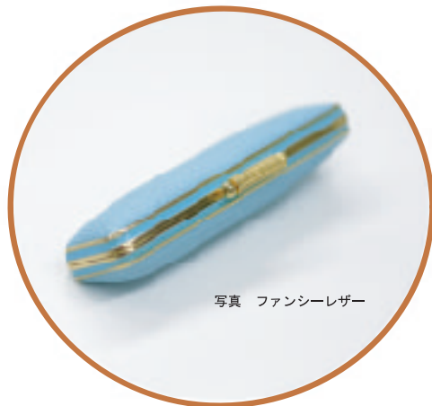
写真 ファンシーレザー

美しく、楽しく、使い易くを追求し、細部までこだわりを持って仕上げました。身近なものだからこそ何気ないところに気を使う事が大切であり、必要だと考えます。印鑑は日本の文化のひとつ、誰もが1本は持っているアイテムです。この2つのフレームは印鑑ケースをより美しく、より使い易くするために開発されたフレームです。